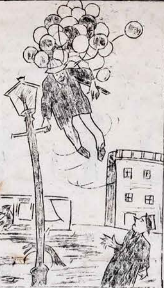
DIDELIŲ GALVOČIŲ PAMĖŽYJIMAS