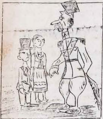
LIETUVOS - LENKIJOS DERYBOS VEL PRASIDĖJO...