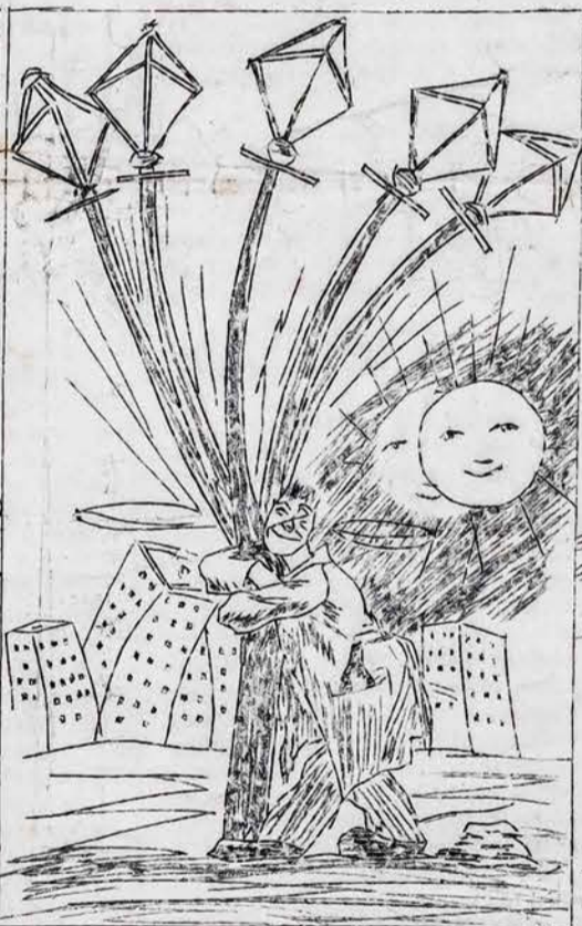
8 VAL. RYTA IŠ LIETUVIŠKO VAKARO.