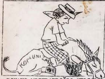
ROKAUS MIZERAPROČIO KELIO NĖ Į "ROJŲ".