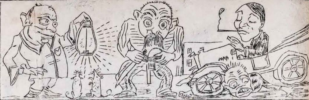
PIŅEIRO NAKTIES IDILIJA TIKROJOJE FAKTU ŠVIESOJE. (Trūksta policijos...)

- Ei, Juozai, kur tu lėdi? - Į Mėnulį brolyti. - Tai atiduok man 50 pesų ką esi skolingas. - Palauk, jei tu ten pasidabos, tai aš tau šifkartę už juos prisiysiu.