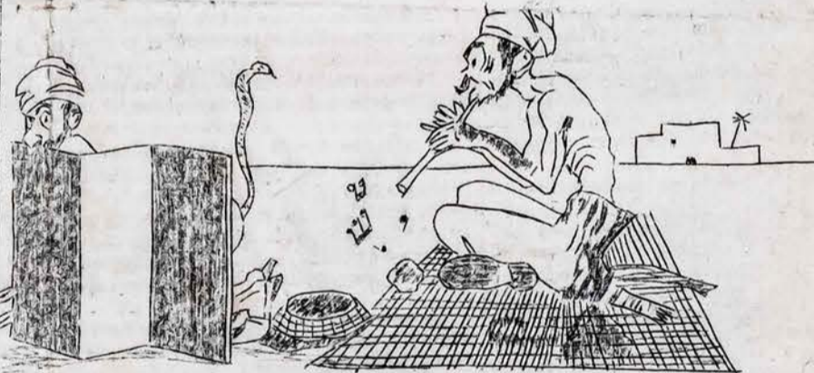
KAIP INDIJOJ GYDOMA NUO PILVO SKAUDĖJIMO. (Car. Univers.)

"RYTOJIEČIAI", 29 BALANDŽIO MINI "1 DIENA GEGUŽIO". (paism. Mizaročiaus evangelija: "-Ir užsikorė ant stalo šveplys šekelis ir tarė: -Dabai kalbės dluagas laspa, plasam visų kliau... tytis, be snekes apie pasistus il jų balsių)."