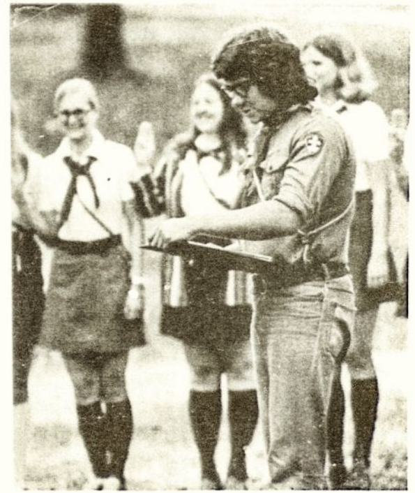
ASD - K! "Vytis" Čikagos skyrių 1974 m. stovykla Rake.