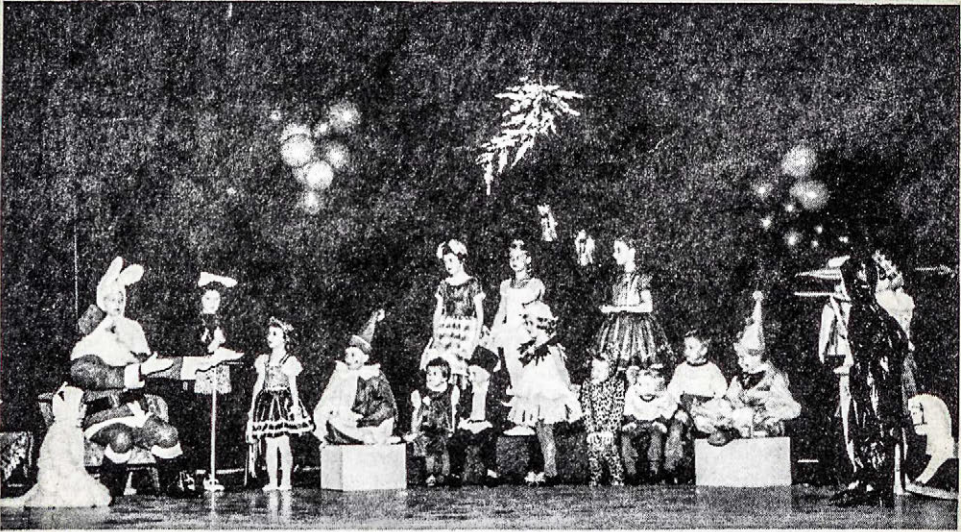
Kalēdu eglutēs parengime vaidintojai.