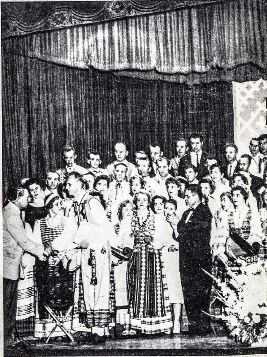
Group of people in traditional folk costumes on a stage.