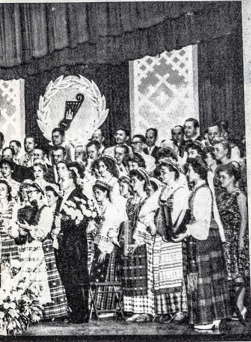
Ohio Liet. Gyd. draugija išteikia Čiurlioniečiams 4 prēmija.