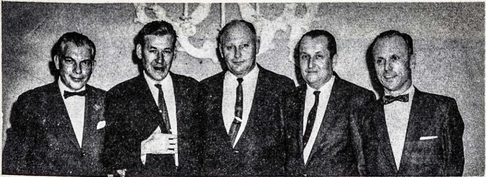
Ohio Liet. Gyd. draugijos valdyba 1962 m.

Amerikos Lietuvių Gydytojų Sąjungos valdybai prašant, OLGD-ja suruošė 2-ji visuotiną Sąjungos suvažiavimą Cleveland'e, 1959 m. rugsėjo 6-7 d. d.