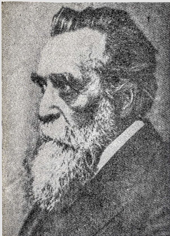
Dr. J. Basanavičius