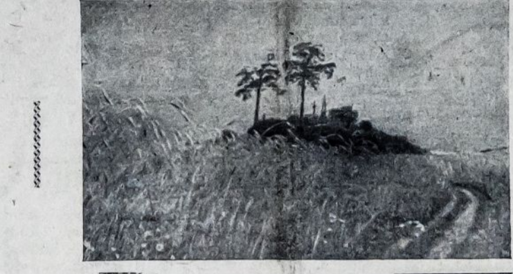
Gražioji Lietuvos Gamta

Reikia rimtų studijų artas Kerenskio pasiūlymas yra įgyvendinamas. Jeigu revoliucionieriams