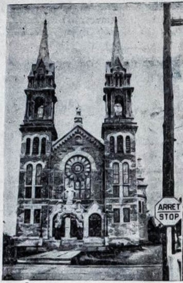
Church—St. Casimir, Quebec

The church itself is built of grey stone just as most churches and buildings in Quebec are. Before the entrance is a stone arch topped by a beautiful statue of the Sacred Heart. On the top of the church in the center be-