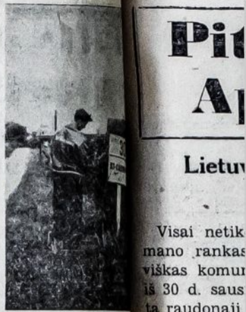
Sign along the side of Route 2 to St. Casimir, Quebec

But the Lithuanian people continue to fight for independence. They are fighting as partisans in the forests. They are fighting insofar as that is possible, at ballot boxes. Even the Russians had to admit that in recent local elections the Communists polled only 11.6 percent of the vote, the rest going to "nonparty" candidates. Above all, they are fighting to