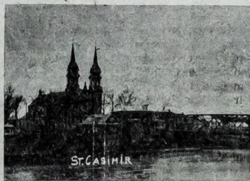
General view of St. Casimir, Quebec, from across St. Anne's River

A young man gave me this explanation. When the French began to come to the New World, the majority came to Canada by way of St. Lawrence river. One group stopped at one place while another at another place. At these stops some decided to build homes on the very banks of the river while others went farther inland. Being staunch Catholics with an intense living faith, they found no more fitting names for their places of settlement than those of the saints. All one has to do to know the truth