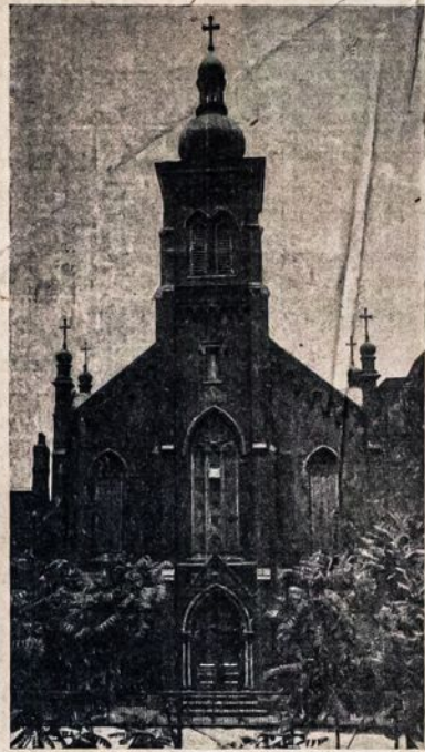
PIRMOJI LIETUVIŲ ROMOS KATALIKŲ BAZNYCIA PITTSBURGHE, South 7th ir Carson Streets, kurioje lietuviai meldėsi nuo spalio mėnesio 1883 metų iki 1901 metų.

BUENOS AIRES, Gruodžio 21.—Amerikos ambasadorius George S. Messersmith lėktuvu išvyko į Washingtoną, suteikti valstybės sekretoriui Byrnes raportą apie pirmus šešis mėnesius jo misijos Argentinoje.