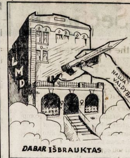
PO RINKIMŲ LIETUVIŲ MOKSLO DRAUGIJOJ PITTSBURGHE