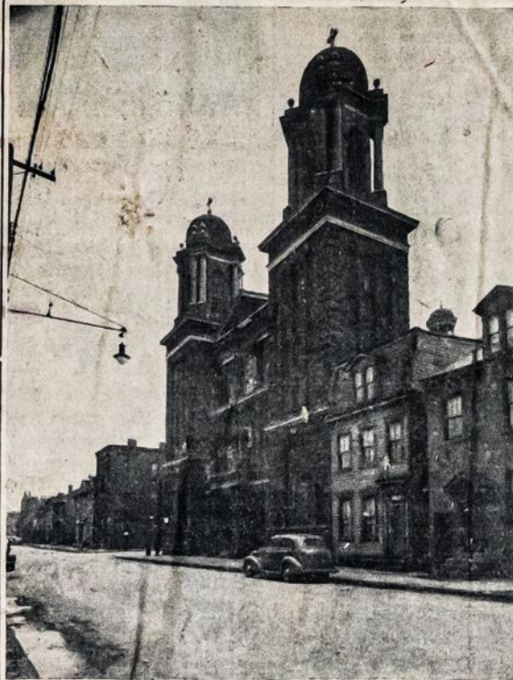
SV. KAZIMIERO DABARTINĖ BAZNYCIA, statyta 1901 metais, kurios sienos atsiėjo $45,000.

TOKIO, Gruodžio 22.—Vienas didžiausių žemės drebėjimų istorijoje, sektas šiuo milžinišku bangų, šiandien atnešė mirtį ir naikinimą daugiau negu 60,000 ketvirtinių mylių plotui pietų Japonijos. Vėliausi raportai sako, jog virš tūkstančio žmonių buvo užmušta ir toks pat skaičius sunkiai sužeista, o šimtai tūkstančių palikti be pastogės.