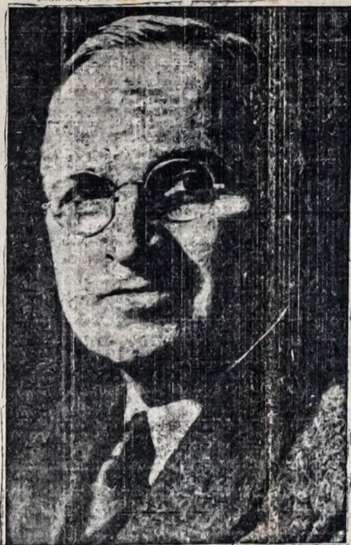
PREZIDENTAS HARRY S. TRUMAN Kuris šiomis dienomis priėmė ALT Delegaciją

Sakoma, jogei Lewis'as turi stiprų argumentą prieš valdžią. Jei taip, tai mainieriai turi progos šį tą laimėti. Ir jiems ne tik negalima laimėjimo pavydėti, bet reikia tiesiog palinkėti.