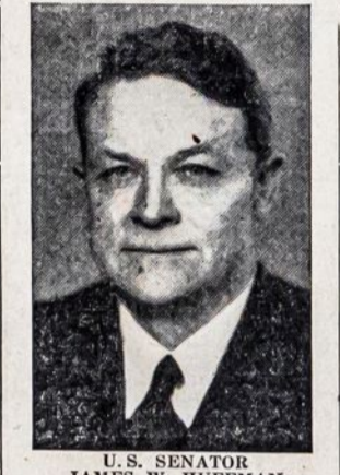
U. S. SENATOR JAMES W. HUFFMAN

Raportai iš visos valstijos parodo, kad Senatoriaus James W. Huffmano kampanija sugražinti jį į U. S. senatą smarkiai įsisiūbuoja ir pasieks savo viršūnę paskutinę savaitę prieš rinkimus. Skaitlingos progresyvių organizacijos visoje valstijoje reiškia savo paramą liberaliam senatoriui karštame laimėjimo konteste su John W. Bricker dėl senatoriaus posto.