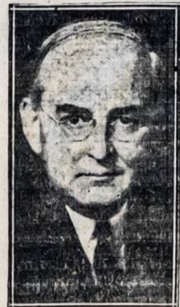
Lietuvos, Pabaltijo ir Visų Pavergtųjų Užtarėjas Senatorius A. Vandenberg Grand Rapids, Mich. kuris rugpiūčio 22 d. prieš pat išskrisdamas Taikos Konferencijon Paryžuje teikėsi priimti net ištisus valandos audijencijon Amerikos Lietuvių Tarybos Vykdomaji Komitetą.