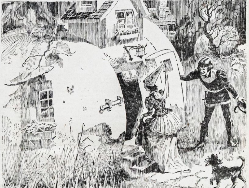
Petras, Petras, dynų ėdikas, Turėjo pačią bet negalėjo ją išlaikyti; Jis įkiso ją į dyno lukštą Ir čia išlaikė ją visai gerai!

Šia proga pravartu pastebėti, kad medžiaga šiam žodynui pradėta rinkti jau prieš 50 metų.