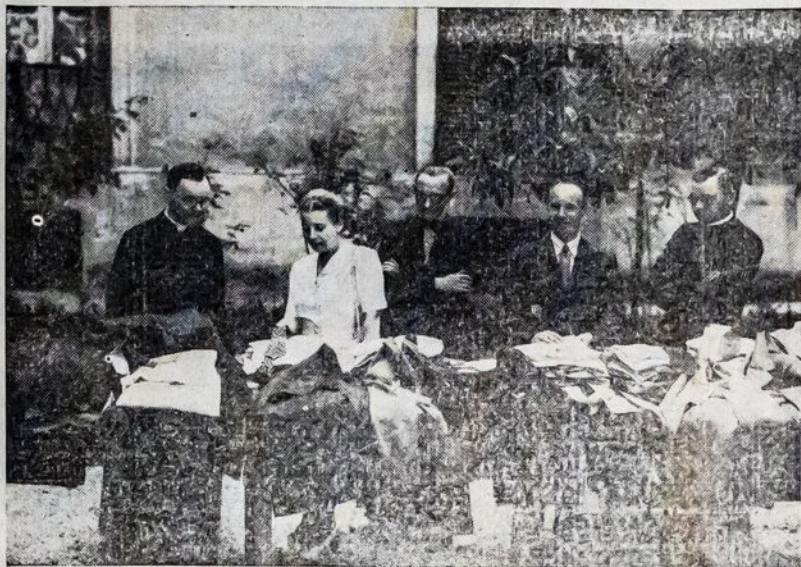
Iš Amerikos atsiųstų, per BALF organizaciją, rūbų išdalinimas Romoje esantiems lietuviams