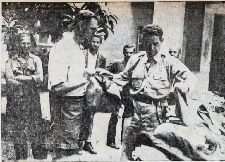
Dalinami rūbai karo tremtiniams kur nors Europoje