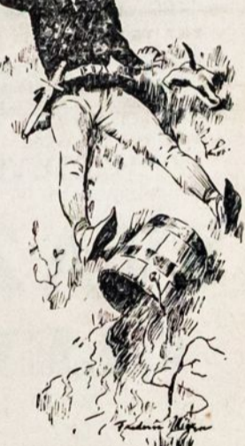
Jack and Jill went up the hill To fetch a pail of water; Jack fell down and broke his crown And Jill came tumbling after!

Nepaisant kad beveik visko kito kainos aukštesnės, mes teikiame elektrą namų vartojimui už mažiausią kainą vidutinei vietei mūsų 53 metų istorijoje.