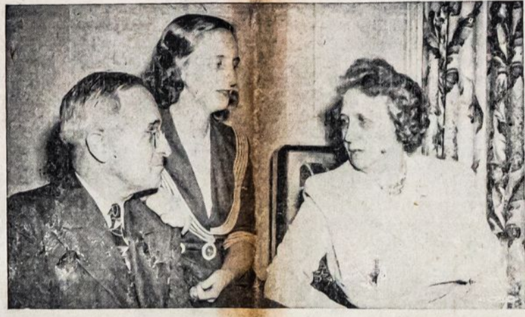
PREZIDENTAS HARRY S. TRUMAN IR ŠEIMYNA

Trečiadienį, 4:30 val. po pietų, San Francisco mieste prasidėjo Pasaulio Saugumo Konferencija, kurią atidarė Jungtinių Valstybių užsienio reikalų sekretorius Stettinius. Pirmą sveikinimo žodį per radio tarė USA prezidentas Truman. Saugumo konferencijoje dalyvauja 46 tautų atstovai.