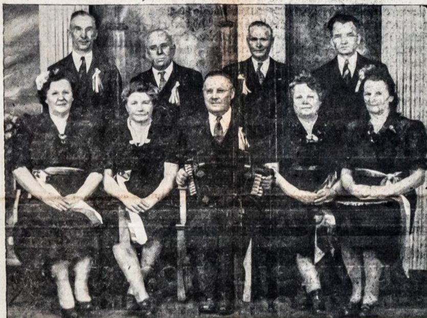
AUKŠTAITISKO KADRILIO SOKĖJAI