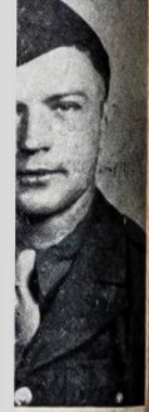
Angelaitis Julijonijus cūzijoje.

TON. — Jungtinių karo išlaikymų sudarė septį 447 milijonų, 4.8 nuoš. daugėjo mėnesiškai. Uspakaičias šuntas ir pranybos įstaiga.