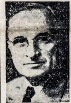
SENATORIUS TRUMAN išrinktas Suv. Valstijų Vice-Prezidentu

Užmuštųjų skaičius jau siekia kelių tūkstančių, jų tarpe yra keli tikybūninkai.