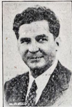
FRANK LAUSCHE išrinktas Ohio Valstijos Gubernatorium

knyga pasiliks pas mus arba bus padėta su kitais dokumentais, naudingais dėl mūsų tautos istorijos.