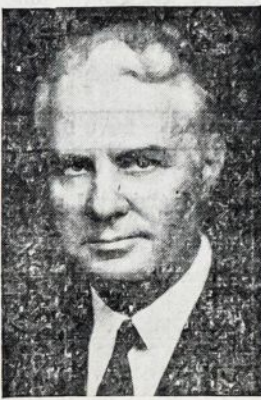
JOHN W. BRICKER Republican Candidate For Vice-President

apsileidimo ir nesugebėjimo rekordų, atliktų tą darbą, kuris stovi prieš akis ir kurio mes, kaip amerikiečiai, turime teisę reikalauti? Negali sulig Naujosios Dalybos geriausių draugų. Net vice-prezidentas Henry Wallace pereiniais metais apibūdino Naująją Dalybą kaip "biurokratiją savo aukščiausioj blygybėj," ir dar pridėjo, kad ji "visiškai nepateisinama tautoje kuri randasi kare."