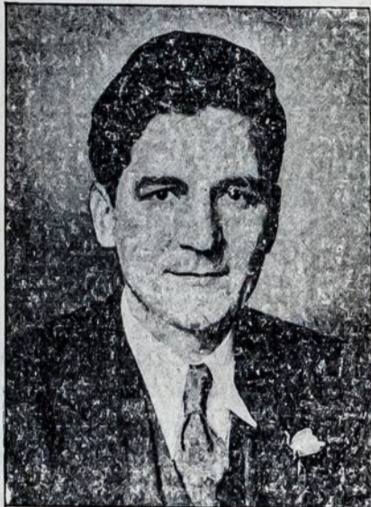
FRANK J. LAUSCHE

Frank J. Lausche, Clevelando majoras ir dabar demokratų kandidatas į Ohio gubernatorių, yra pasididžiavimas visų Ohio tautinių grupių. Majoras Lausche yra puikus pavyzdys didžiųjų progų kiekvienam gyvenančiam demokratinėje Amerikoje. Sūnus paprastų darbininkų slovenų atelių, gimęs ir užaugęs tarp kitų atelių, pats savo pastangomis išėjo mokslus ir tapo valdytoju vieno iš žymiausių šios šalies miestų.