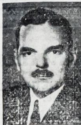
THOMAS E. DEWEY Republican Candidate For President

Ar yra galimybė, kad dabartinė administracija, su jos beryžtingumu,