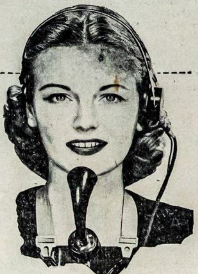
Buy War Bonds for Victory

K ARAS prie pat jos pirštų galų. Ji pralaidžia šaukimus kurie atlieka dalykus. Kai kada kai jūs telefonuo- jate ir Ilgojo Susisiekimo vieleš užimtos, jūs išgirsite ją sakant—"Malonėkite sa- vo šaukimą apriboti 5 minu- tėms." Tatai pagelbsti visiems pa- ciliui.