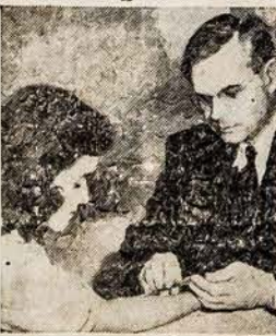
High school girl, above, receives tuberculin test from doctor. Tuberculosis associations, supported by Christmas Seals, help guard health of school children.