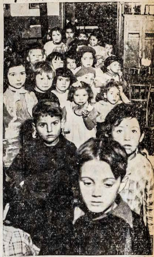
ANXIOUS EYES WATCH. Food is dispensed at school and is the one meal of the day. Quietly and orderly they await their turn for there is no food at home. Agencies of the National War Fund will help build a new generation of strong and healthy citizens.