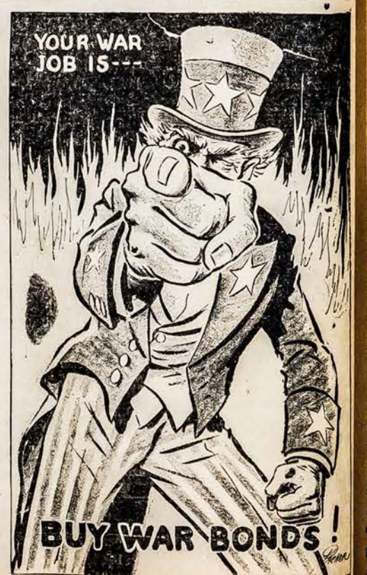
U. S. Treasury Department.