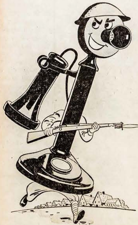
Užsuk savo radio ant telefono kompanijos valandų: 9 P. M. WTAM, WLW and WSPD

Gulstiegi vienrankiai telefono aparatai naudojami karo reikalams. Metai atgal mūsų Western Electric dirbtuvės buvo pervestos nuo išdirbimo civilinio vartojimo telefonų į išdirbimą įrankių svarbiausiam karo susisiekimui. Visuose karo frontuose tie mūsų išdirbimai gelbsti laimėti karą. Naminiame įdedami pastatomieji telefono aparatai. Jei tamstai įdedamas pastatomasis telefono aparatas vietoje gulščiojo, kuris tarnauja karo laimėjimui, tai tą tamsta gerai supranti.