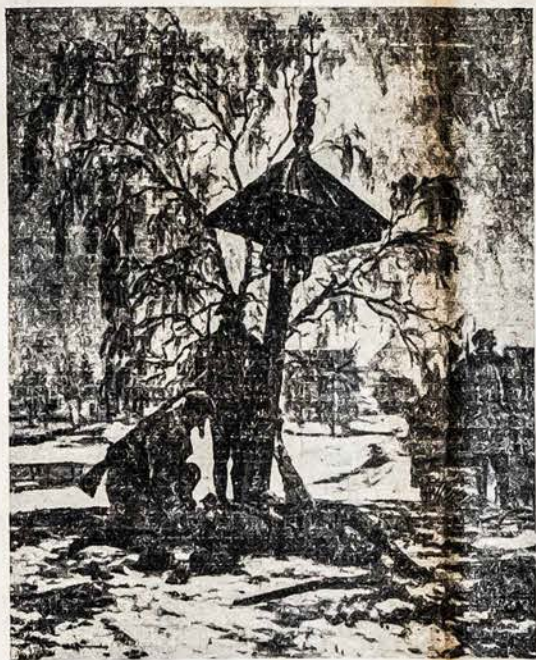
Be Aukų ir be Kovos nebuvo ir nebus laisvos Lietuvos