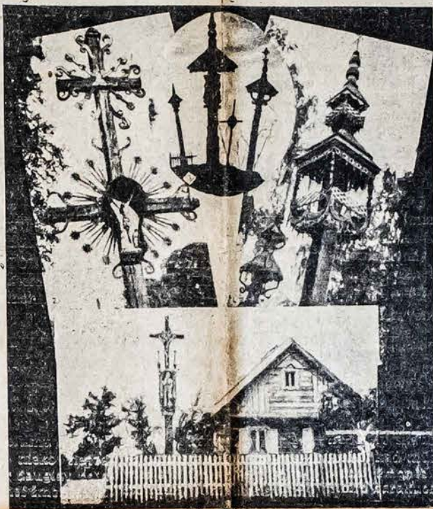
Lietuviams Kryžius yra simbolis netik kančios bet ir Prisi-kėlimo.—Visi mes tikime, kad Lietuva, šio karo eigoje, daug kančių iškentėjusi, pragaliau sulauks savo prisikėlimo valandos.