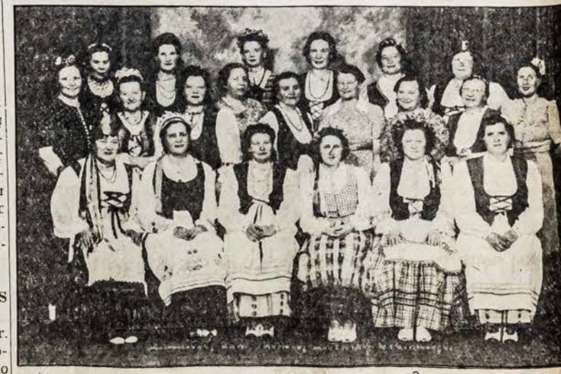
CLEVELANDO MOTERŲ GRUPE Kuri dainuos Lietuvos Nepriklausomybės Jubiliejinėse iškilinėse, 21d. vasario, Lietuvių Svetainėje.