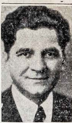
Mayoras Frank J. Lausche