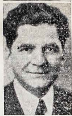
Mayoras Frank J. Lausche

Susidaręs iš visokių pažiūrų žmonių Clevelando Lietuvių Vienybės Komitetas rengiasi prie nepaprastų iškilmių — Lietuvos Nepriklausomybės 25 metų sukakties minėjimo, kuris įvyks vasario 21 dieną, Lietuvių Svetainėje. Jau baigiami visi prirengiamieji toms iškilmės darbai. Komiteto delegacija aplankė Clevelando Miesto Mayorą F. Lausche, kuris maloniai pasižadėjo atvykti ir pasakyti kalbą. Mayoras labai pagyrė Komiteto nusistatymą — pusė šio minėjimo pelno skirti Amerikos kariuomenei, kurios aukomis ir pastengomis tik gali būti išgelbėta Lietuva. Pakviesta ir daugiau svečių Amerikonų ir kitų valstybių konsulai, kurie gyvena Clevelande Komitetas rupinasi gauti gerų lietuvių kalbėtojų iš visuomenės vadų tarpo.