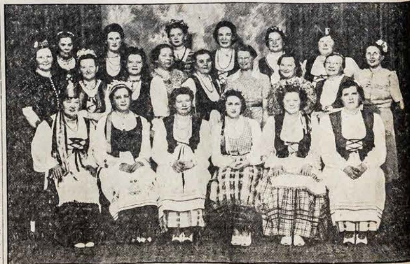
CLEVELANDO MOTERŲ GRUPE

Daimos Lietuvos Nepr. iškilmėse 21d. Vasario, Lietuvių Svetainėje.