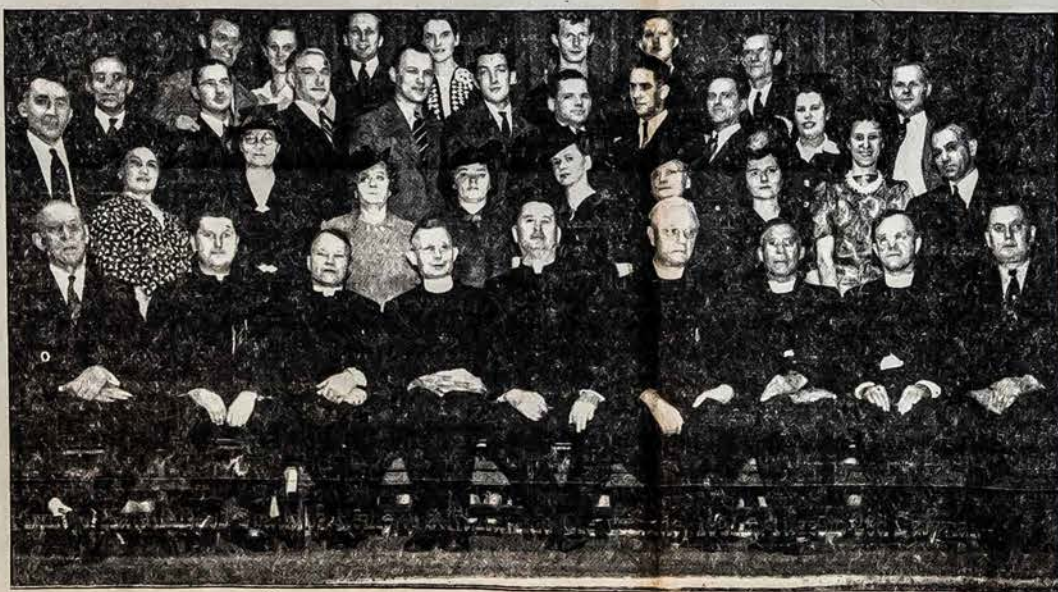
Pirmojo Katalikiško Spaudos Remėjų Suvažiavimo Cle velande, 1941m. rugsėjo 28d Dalyviai.

Pažymėtina, kad Federacijos valdyba Amerikos Lietuvių Tarybai paskyrė iš izdo šimtą dolerių. Vadina praktišku būdu paremta Amerikos lietuvių bendrosios veiklos reikalai.