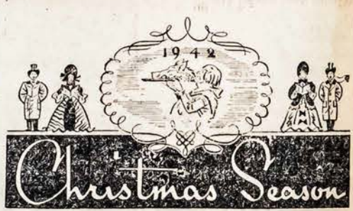
Linksmų Kalėdų ir Laimingų Naujų Metų