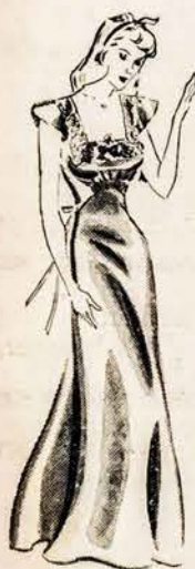
Exquisite Rayon Satin Gowns