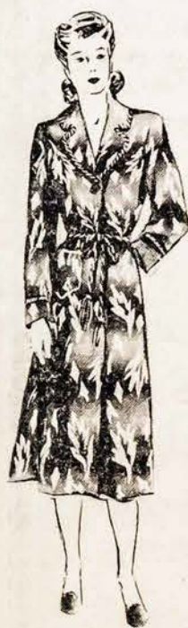
Warm "Beacon" House Robes