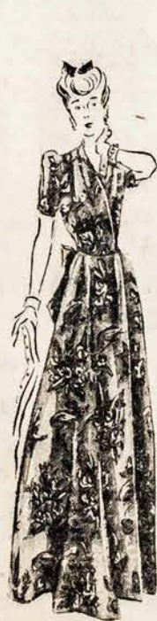
Colorful Robes of Seersucker