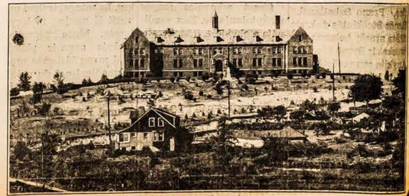
Šv. Pranciškaus Vienuolynas, Dievo Apveiz dos kalnė, Pittsburgh, Pa.

— Teko lankyti "Bingo" kuris pasekmingai įvykdė ketvirtadienio vakarais. Parapijiečių uolumas ir pastovumas parapijos labai yra gražus ir pavyzdingas. Vakara per "Bingo" žaidimą. Tęsinys 5 pusl.