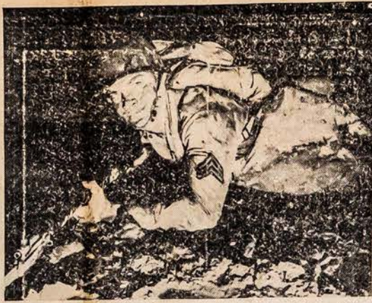
Rain or shine, the Army fights—so regardless of weather conditions the Army War Show will be staged nightly in the Cleveland Stadium Sept. 18 through Sept. 22. This rugged looking sergeant, wallowing in the mud, was photographed during the realistic battle action on a rainy night in Chicago's Soldier Field. More than 300,000 are expected to see the five performances in Cleveland.

Rugs. 18 d. Clevelando Miesto Stadijone prasidėjo Suv. Vals. Kariuomenės pasi- rodymas. Dalyvaus virš 2,000 kareivių. Programas susidės iš 21 kavalko.