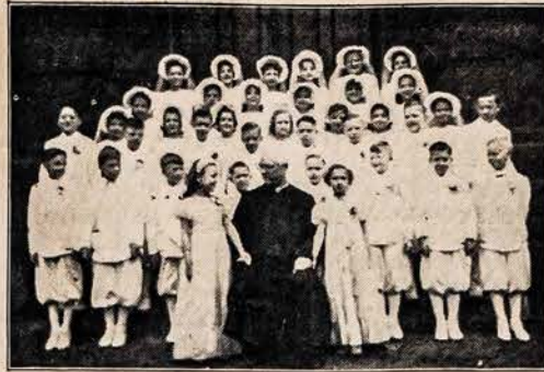
SV. KAZIMIERO PARAPIJOS VAIKUČIAI PRIĖMĖ PIRMĄ KOMUNIĄ 1942 M.

— Ateinančią savaitę turėtu visi prisidėti ir sulig komiteto išdirbto plano, uoliai darbuotis, kad tikrai būtų pasėkmingas. — Liepos gi 12 d. po piet rengiamas Maironio choro privatis (tik nariams ir narėms) išvažiavimas į Adomo sodą. Išrinktoji komisija jau darbuojasi, kad visas Maironio choras turėtų užtekti naujų ir gražių pasilinksminimų. Nariai ir narės visi bukite liepos 12 d. Adomo sode. — Šiose dienose Pittsburghe įvyksta SLA ir Sandaros seimai. Pastebėtina, kad juose dalyvauja žymus katalikų veikėjai; daktarai, advokatai, profesoriai ir kiti žymūs veikėjai. Katalikui apie tai iš šalies nemalonu girdėti, o mūsų tautiečiai ir nezaiežninkai triumfuuoja. Kaip čia su tais mūsų "katalikais" yra — sunku perprasti. Gal tą mokytiesni paaiškintu, nes paprastam artojiui tokie dalykai nesulenda į menką artojaus galvą. Kaip katalikiškame veikime, tai nei vieno nėra daktaro, nei profesoriaus, nei advokato, nei šiaip sau gabesnio veikėjo — reikia pasitenkinti tretininkais ir šiaip sau paprastomis moterėlėmis.