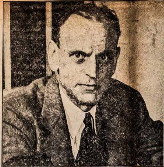
Civilian Defense Vyr. Direktorius James M. Landis

Už tokia programą, kokią antradienį matysime ir gir- dėsime Public Auditorium reikėtų mokėti kelis dolerius, Bėgyje ateinančio mėnesio