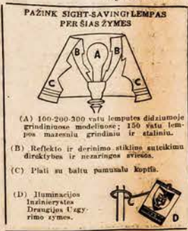
PAŽINK SIGHT-SAVING LEMPAS PERSIAS ZYMES

Kad turėti Sight-Saving Šviesą, reikalinga nors po vieną Sight-Saving Lempą kiekvienam šeimos nariui.