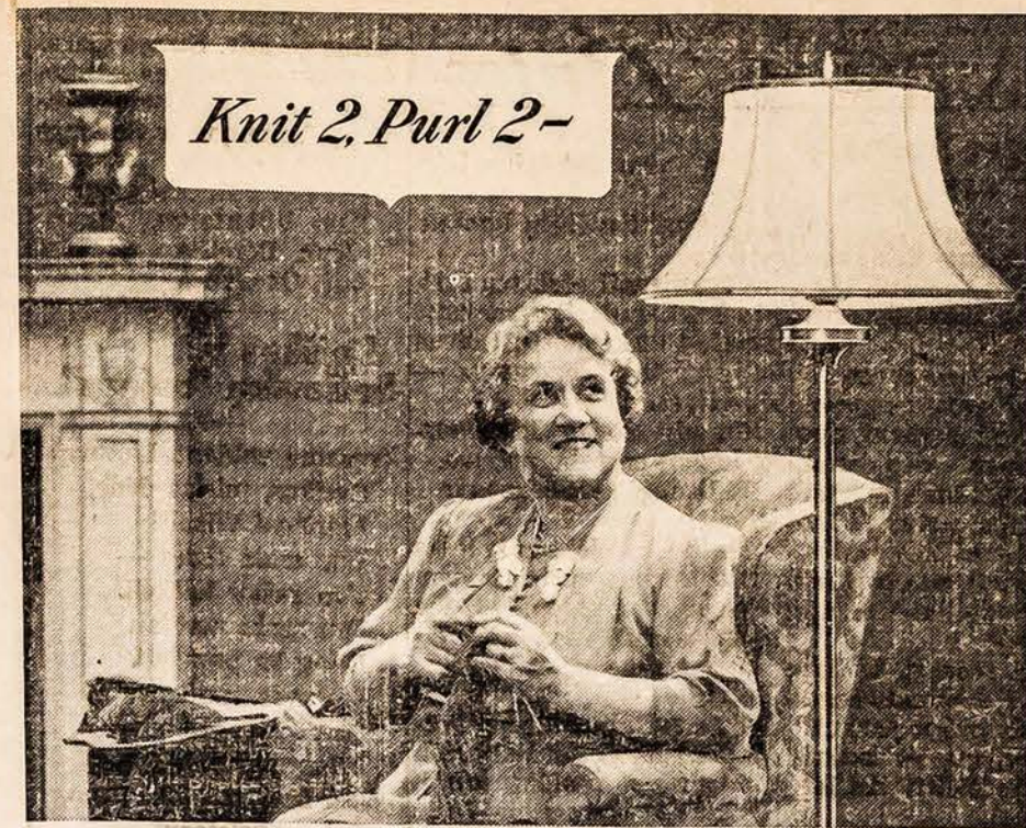
Knit 2 Purl 2-