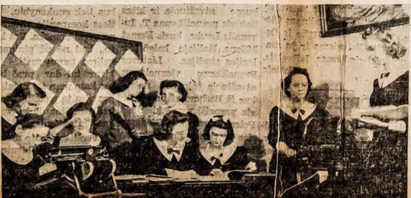
Pranciškėčių Akademijos Pittsburgh, Pa. Komercijos klasė.