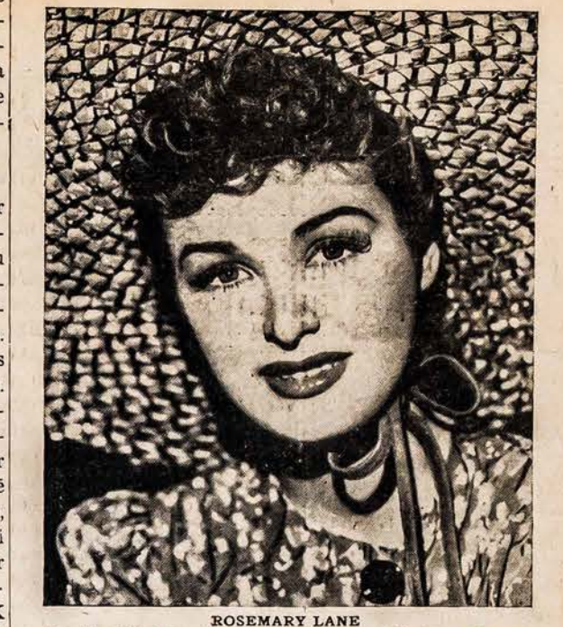
ROSEMARY LANE Fire Festival of Freedom in Cleveland Stadium, July 4 at 8:30 p. m.

Liepos 4 d. — Suv. Valstijų Nepriklausomybės Dienos šventėje Miesto Stadione įvyks Laisvės Festivalas. Iškilmės prassidės 8:30 vak. Galima spėti, kad šis milžiniškas įrengimas pralenks ir praieitų metų. Programe dalyvaus žymi artistė, Rosemary Lane. Dainuos didelis koras, paveiksiai ir "fire works."