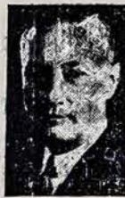
Martin L. Davey

Ar jus žinote, kad Martin L. Davey buvo du kartu nominuotas ir išrinktas gubernatorium ir buvo vėl nominuotas šį metą?