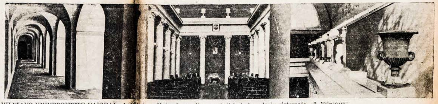
VILNIAUS UNIVERSITETO VAIZDAI. 1. Vilniaus Universiteto pastogis iš kiemo pusės. Universitetas buvo įkurtas prieš pusketvirtą šimto metų ir vėliau kaikurie pastatai perstatomi, kiti pristatomi, tačiau pagrindiniai visais centrinis universiteto pastatas tebėra labai senas, kas galima matyti ir jo koredorių sistemoje. 2. Vilniaus Universiteto iškilmių salė (aulė), kurioje vyksta imatrikuliacijos, mokslo baigimo aktai, taip pat kitos su mokslu susijusios iškilnės. 3. Vilniaus Universiteto vieno balkonų profilis. Antrame puslapyje randasi neišsivysęs, bet įdomus Vilniaus Universiteto istorija.

PARYŽIUS, bal. 8 — Iš Amerikos čia grįžo J. A. Vallstybių ambasadorius Prancuzijai W. C. Bullittas.