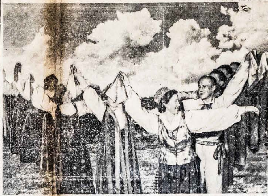
Lietuvoje gaivunami senovės tautiškieji šokiai. Jie jaunuomenės yra labai mėgiami. Siame atvaizde matome jaunuomenę tautiškais drabužiais šokančią senovės žemaičių tautišką šokį Bleizdingelę.

* Lietuvos pašto valdyba išleis Tautinės Olimpiados pašto ženklus. Šie ženklai šiek tiek brangesni, negu paprasti ženklai. Kainos skirtumas eis Tautinės Olimpiados Komitetui.