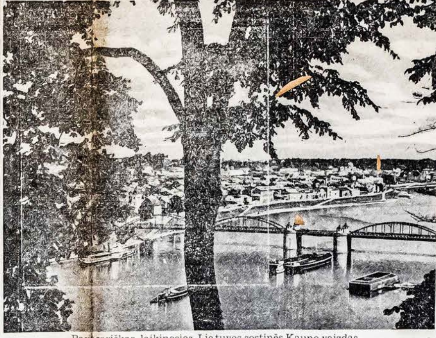
Pavasariškas laikinosios Lietuvos sostinės Kauno vaizdas

* Kaune įvyko Lietuvos, Latvijos ir Estijos bibliotekininkų kongresas, kuriame dalyvavo keliosdešimt bibliotekų reikalų žinovų. Kongresas posėdžiavo Kaune, Marijampolėje ir Siauliuose.