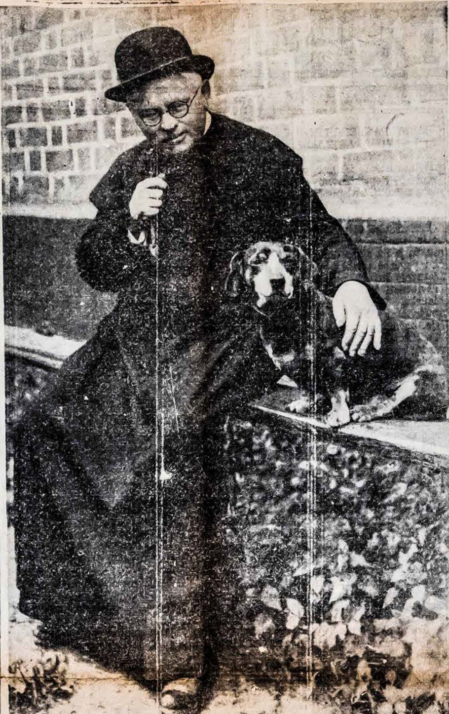
Kun. Dr. Juozas Tumas Vaišgantas, vienas iš žymiausių Lietuvos rašytojų ir vabaladžio 29 d. sukako penkikjū. Nuo jo mirties š. m. kerį metai.

Jei šiuo metu įsigilinam į Lietuvos istoriją, tai tenka gailėtis, kad lietuvių tauta priėmė krikščionybę labai vėlai. Kadangi viduriniais amžiais krikščioniškoji civilizacija (dvasinės ir medžiaginės pažangos laipsnis) buvo vienutėlė europiška civi-