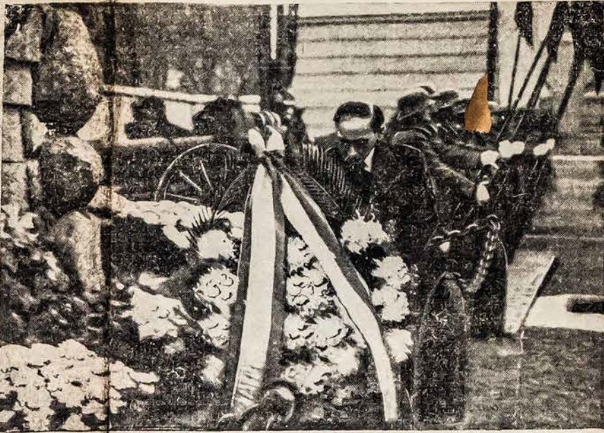
Naujas Vengrijos nepaotas ministeris Lietuvai Bestarsca, deda vainiką prie prastas pasiuntynys ir įgali-la Torok de Mura et Roro-Nežinomojo Kareivio kapo.

Užkaukazio lietuvių suvažiavimo 20 metų sukaktuvė rengimas to suvažiavimo minėjimas Kaune.