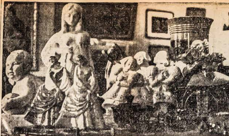
VAIZDAI IS LIETUVIŲ MOTERŲ MENO PARODOS

Grijtant prie Lietuvos gyvenimo, reikia pasakyti, kad mūsų autoritatyvinis režimas yra tik dirbtinis, tik prievartos ar karjeros sumetimais. Jis neina iš plačių masių, jis nesukelia jokio entuzijazmo. Tai yra dėl to, kad jis neturi stiprios, tautinius idalus įkūnijusios asmenybės. "Bet, pasakysite, ponas Valstybės Prezidentas Antanas Smetona? — Taip, pilniausiai sutinkam, ponas Antanas Smetona yra, beabejo, didelis žmogus, bet jis yra gimęs buti tik Prezidentu, o ne tautos vadu, gebančiu priduoti energijos ir entuzijazmo savo valdiniam. P. Ant. Smetona yra labai nuosaikus ir išmintingas žmogus, tolimas bet kokių ekstravagantiškumų ir nuotikių politikos. Tokiu jis ir turėtų pasilikti. Tačiau labai juokinga, kai gimeš buti prezidentu pradedamą vaidinti kitų nepripažintą tautos vado rolę, kai per fas et nefas nori pasidaryti Lietuvos Mussolini. Todėl, nesant iš prigimties stiprios asmenybės, supranta, kad tas sukeltas tauti-