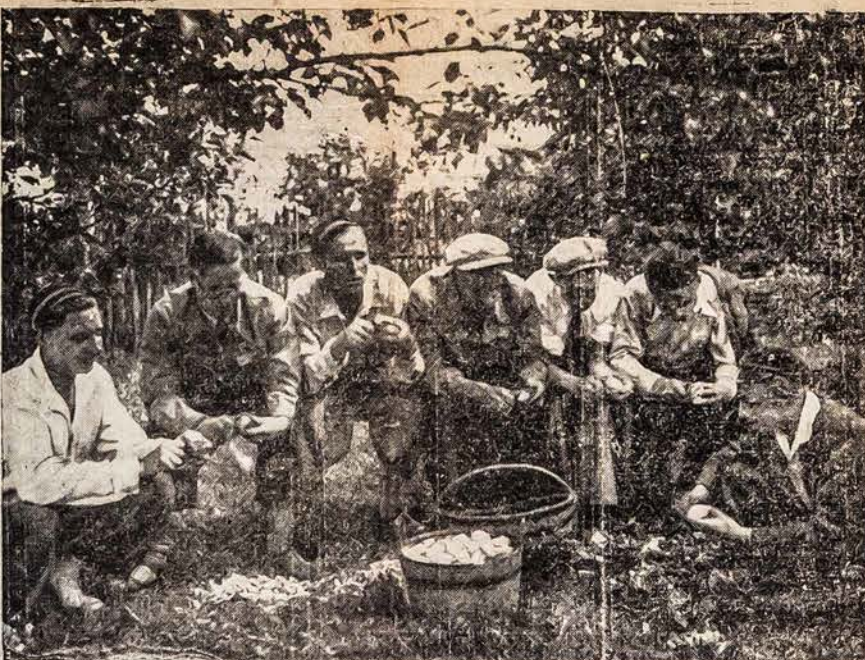
Vilniaus universiteto lietuvių studentija ekskursiją uždariusi Vilniją me-

Šiems neleidžianti jų pasavežiura. Taigi dėl šių motyvų ir buvo ši patalpa įdėta. Taip rašo Lietuvos laikraščiai.