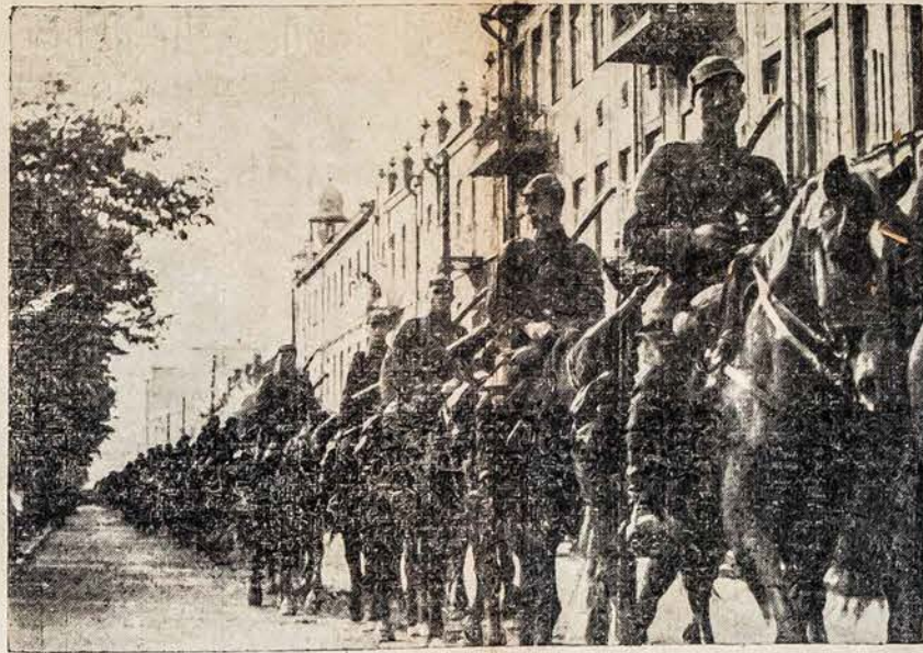
Saukieji Lietuvos bernukai grįžė iš šio rudens manevrų, grįžė iš šio rudens manevrų, mergelių gėlėmis apkaityti joja laikinosios Lietuvos sostinės Kauno gatvėmis.

BOSTON, Mass., spal. 7. — Teismas nubaudė po 200 dol. bauda dvi amerikietes "aristokrates" (turtingas dykaduones) už gimdimų kontrolės propagandą.