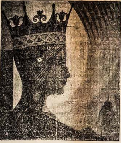
Lietuvos karalaitė, liet. dailininko K. Simonio paseikslas

nokyti. Kiek pasimokė šiauliuose, persikėlė į Kauną, "Saulės" mokytojų kursus. Tačiau ir tiei mokslai jis 1909 m. išvyko į Ameriką laimės ieškoti. Čia gyvendamas Philadelphijoje ir New Yorke, dirbo restoranuose. Sunkus darbas neleido jam mokyti. Tad po metų vė sugrįžo į Lietuvą. 1911 m. buvo paimtas į kariuomenę ir išstarnavo ligi Didžiojo Karo. Kilus karui, su rusų