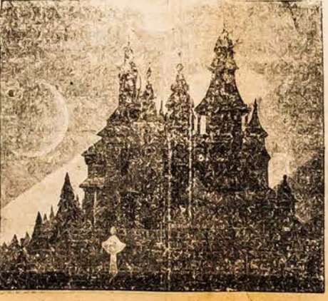
Vaikelio miestas, liet. dailininko K. Simonio paveikslas.

Tavo jūros, ežerai ir upės — mano sielai skaisčios dilybės šaltinis". Tsb.