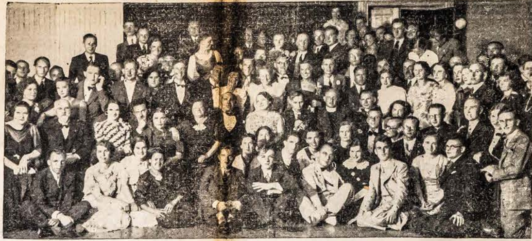
Rugpjūčio 14 d. Kaune "Metropolio" salėje Užsienių Lietuviams Remti Draugijos valdyba surengė susipažinimo ro dalyvių, su ministru pirmininku J. Tubeliu viduryje.

LONDONAS, rugs. 3 d. — Mirė britų generolas Frank P. Crozieras, Pietų Afrikos ir pasaulinio karų veteranas, parašęs eilę kariškų veikalų. Buvo 58 m. amž. Gen. Crozier kokį laiką buvo Lietuvos vyriausybės kariškas patarėjas Lietuvai organizuojant kariuomenę.