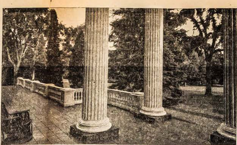
Marianapolio Kolegijos Veranda