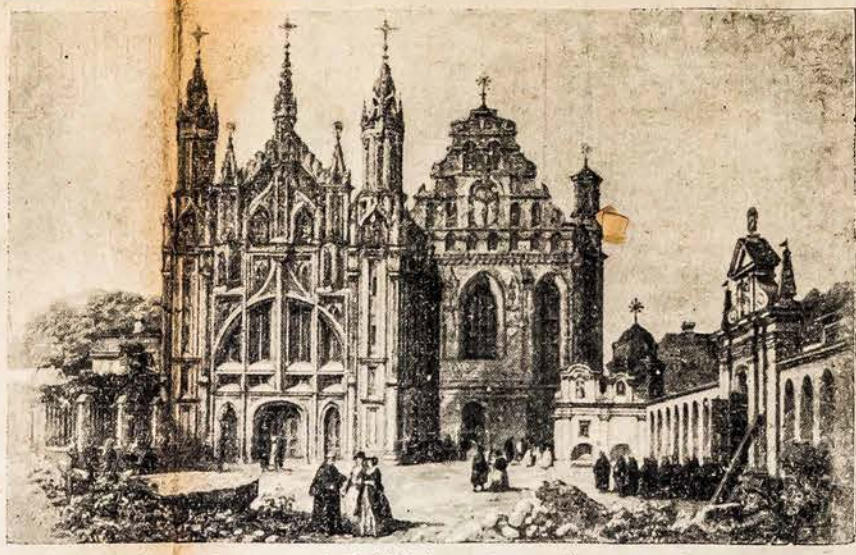
Lenkų okupuotoje mūsų sostinėje Vilniuje yra daug gražių ir architektūros atžvilgiu didžiū vertingų bažnyčių. Šiame paveiksle matome Šv. Onos ir Bernardinų bažnyčias; dešinėje matyti Šv. Mykolo bažnyčios šventorius.