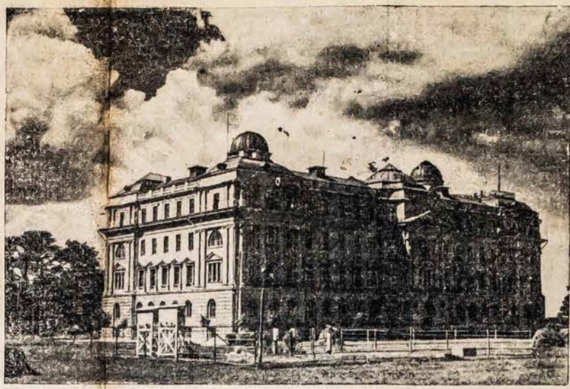
Vytauto Didžiojo universiteto Kaune fizikos-chemijos instituto rumai. Jie stovi garžioje vietoje ant Alesoto kalno.

TOKIJO, rugp. 17. — Japonijos vyriausybės nuosprendžiu japonų ambasada Nankinge, Kinijoje, uždaro ma ir visi konsulai iš Kinijos jos ištraukiami. Taip pat atšaukiami ir civiliai japonai.