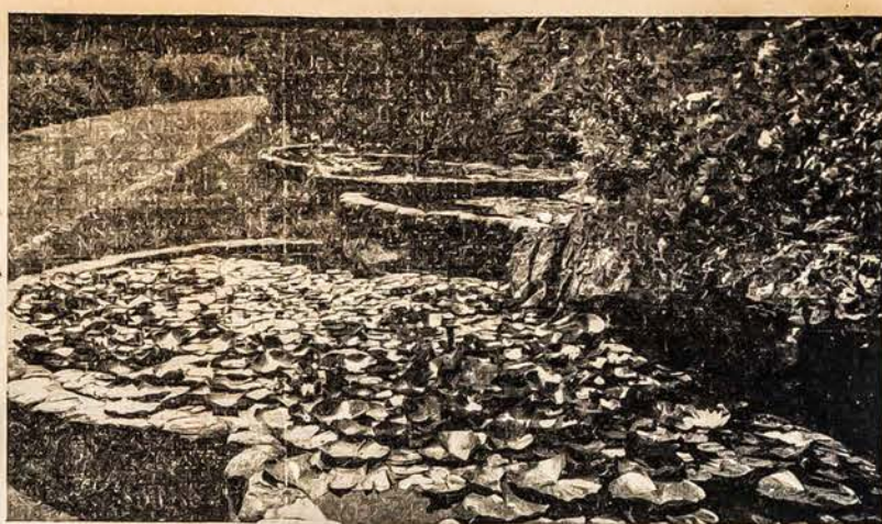
Marianapolio Kolegijos Parke Auksažvynė

Siemet turime gerą me- daus derlių. Patenkinę savo reikalavimus, dalį medaus galėsime eksportuoti užsien- iui.