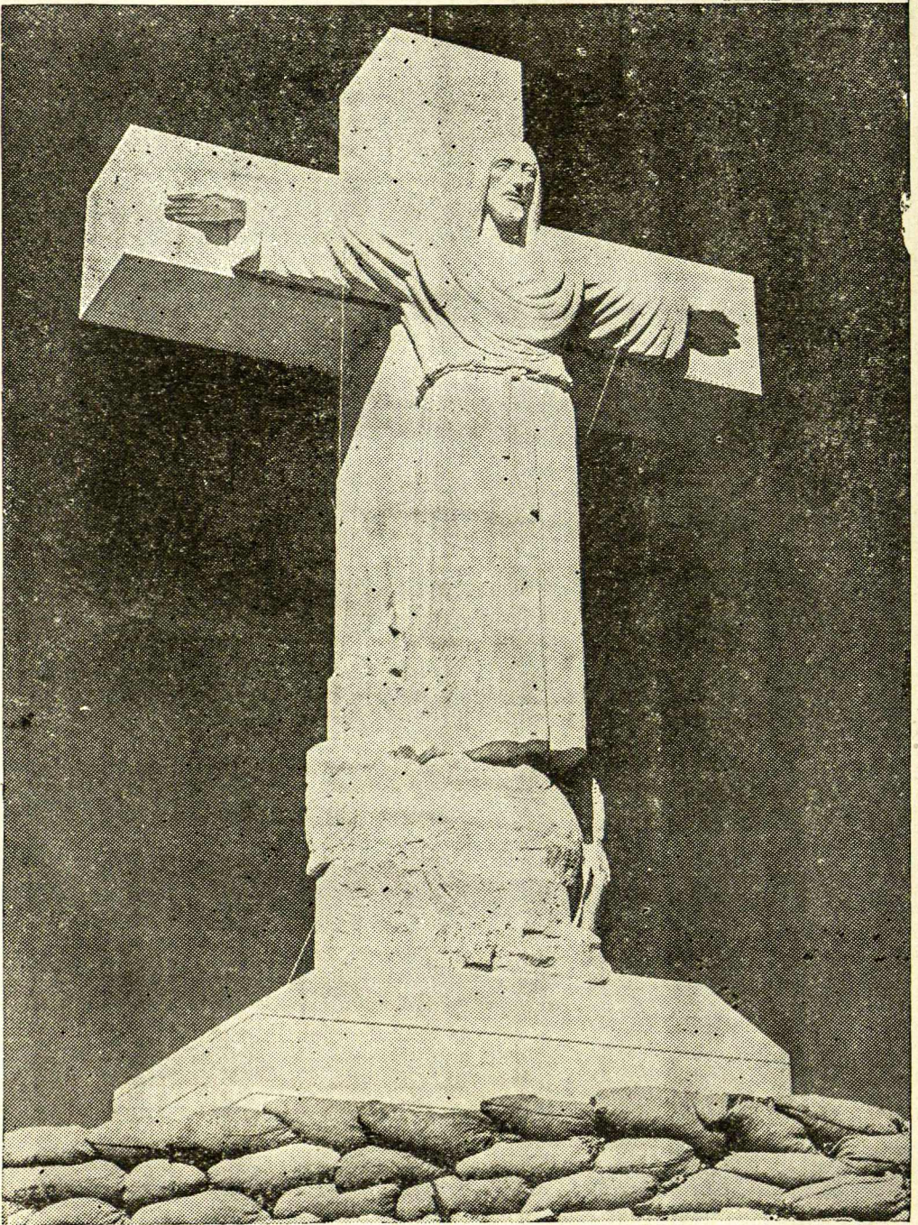
Kristaus Karaliaus statula El Paso, Texas .