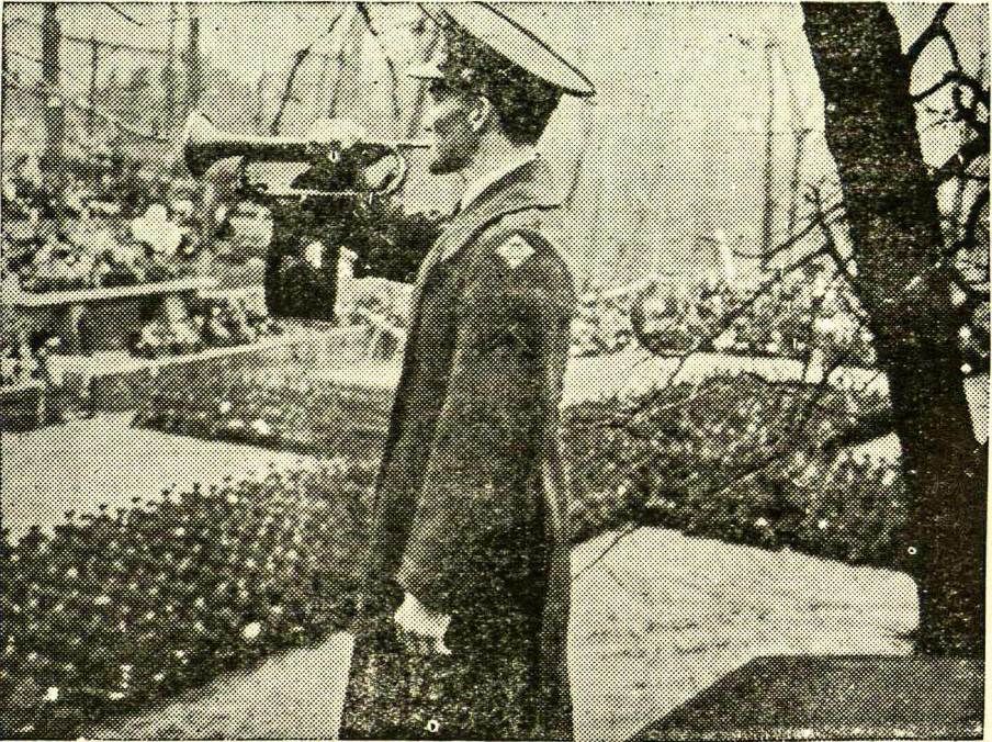
Trimitu Šaukia Į Pratybas.