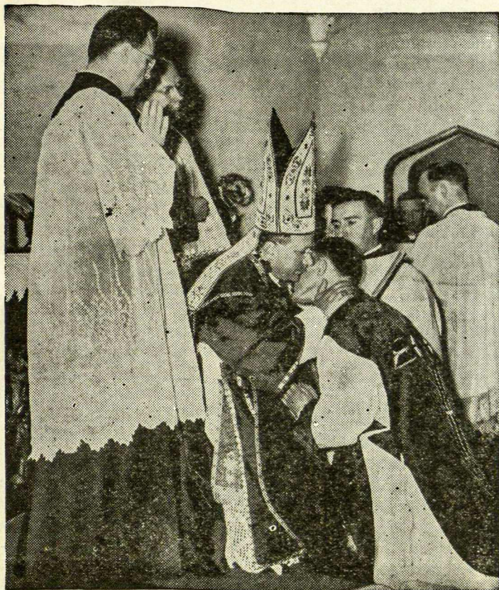
J. E. Arkiv. A. G. Cicognani, išventi- nęs Tėvų Ma- rijonų klieri- kus kunigais bučiuoja juos.