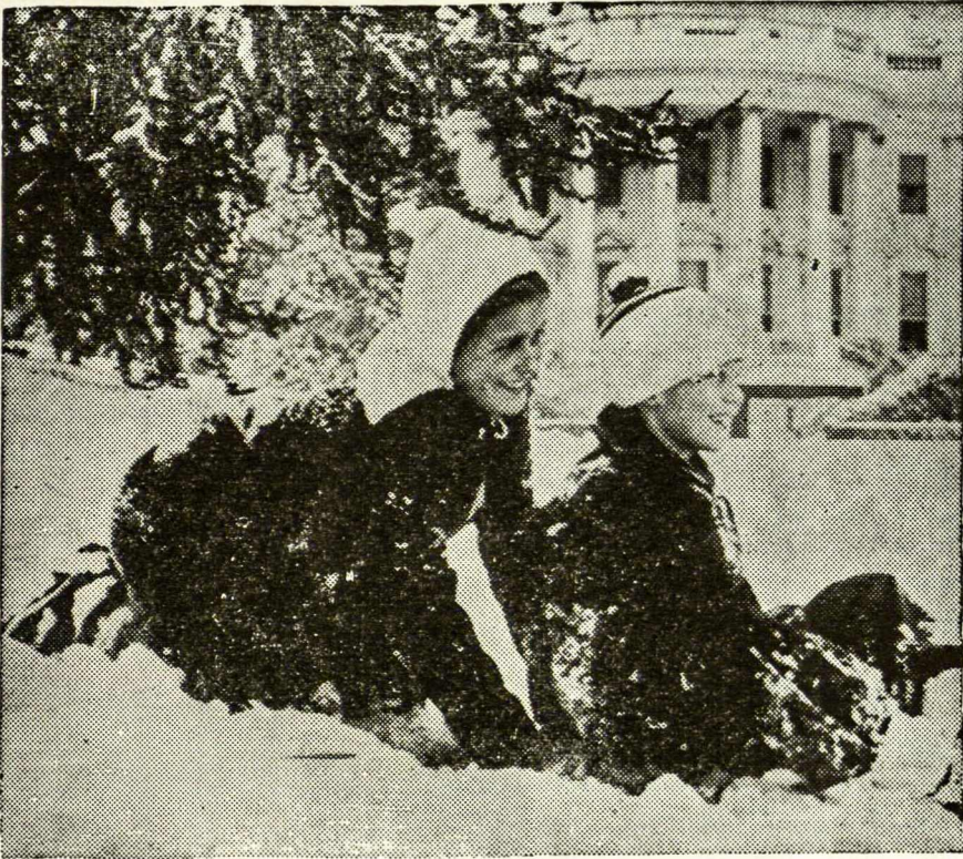
Žiemos džiaugsmas prie Baltųjų Rūmų.

justume permainą savo santykiuose su Jėzumi! Mūsų Šv. Mišios, Šv. Komunija, Švenč. Sakramento lankymai, būtų žymiai kitoki. Tikėjimas, viltis ir meilė naujomis spalvomis suklestėtų mūsų sielose; ir neapsakomam džiaugsmame mes sušuktume: “ Aš žinau, ką įtikėjau ” (II Tim. 1).