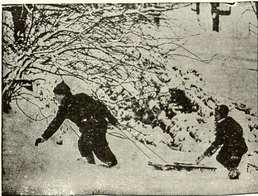
Žiemos vaizdas Cincinatti, Ohio.

Broun mirė gruodžio 18 d. sulaukęs tik 51 metų; jo atminimas, kaip liūdija gausūs įvairių žmonių nuomonių pareiškimai, bus labai ilgiems laikams, o gal ir tol, kol bus spauda, per kurią jis sąžiningai tarnavo žmonijai.