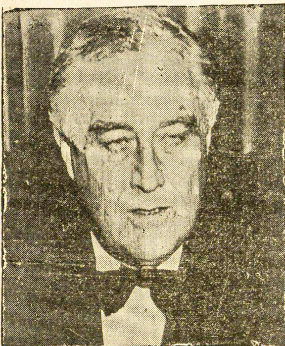
Prezidentas D. Rooseveltas