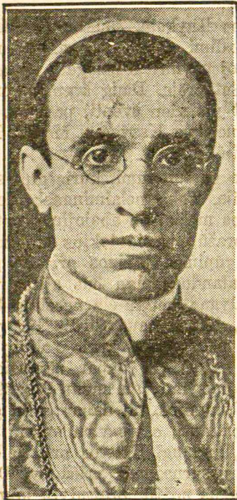
Šventasis Tėvas Pijus XII (Kardinolas Pacelli.)

VATIKANAS, kovo 2. — Jo Eminencija Eugenio kardinolas Pacelli šiandien išrinktas 262-uoju Popiežium. Pasivadino Pijum XII.