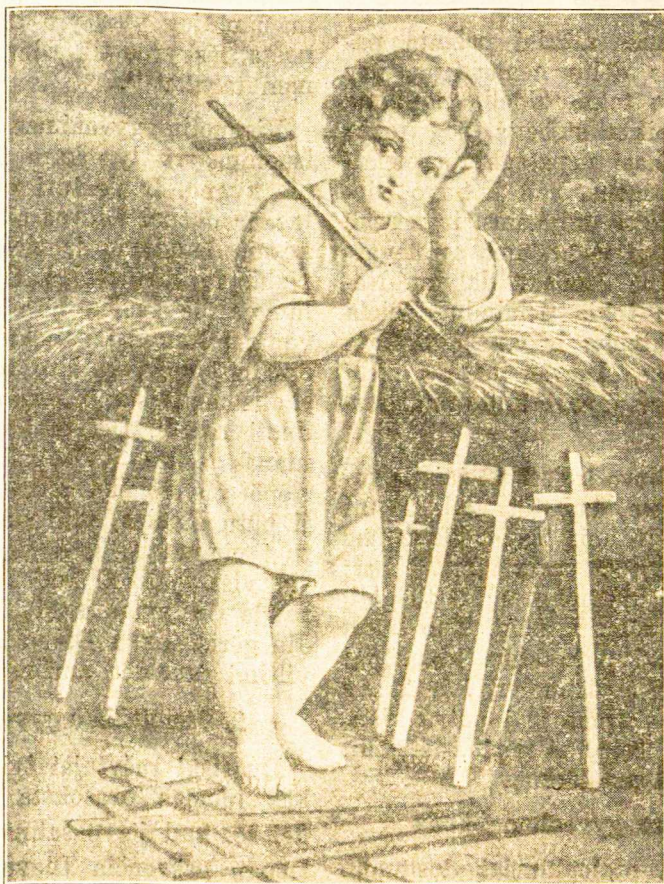
“Niekas neturi didesnės meilės, kaip tą, kad kas guido savo gyvybę už savo prietelius.” (Šv. Jono 15, 13—14).

T ARPE neaukštų bet skaitlingų žaliuojančių kalnelių, tarpe dviejų atstui tekančių upių, Tiberijas Provincijoje, Palestinoje, prie ilgo kelio, einančio iš Nablus net į Damaską, randasi graži, žaliuojanti pailga lyguma, kurios viename krašte, netoli kalnelių, stovi baltutėlis, kalkėmis nudažytas, tarsi žydinčių baltųjų aguonų žiedai, pilkai žaliuojančioje lygumoje, mažas, prastutėlis, — rodos, nieku ypatingu nepasižymys, ir jokios gilesnės reikšmės nebeturįs, Nazareto miestelis. Viso pasaulio katalikų, o kartu dar ir daugelio įvairių protestantų lūpose, — daugiausia kaip kiti visi pavadinimai ar vietovardžiai bei miestai, — figūroja trys vardai, — istorinių vietų pavadinimai: — Betlėjus, Nazaretas, Jeruzalė!