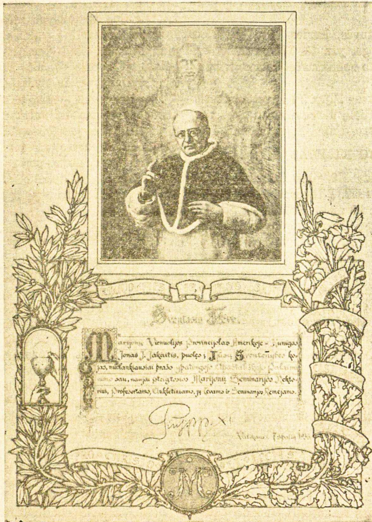
Pijus XI palaimina Marijonų Vencuoliją, TT. Marijonų Bendradarbius ir Rėmėjus.