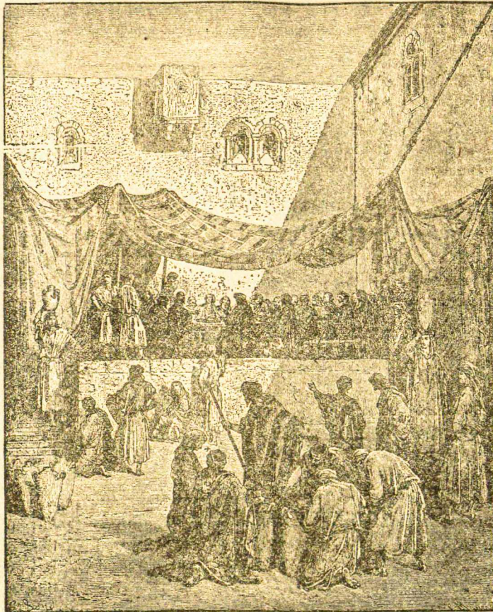
Vestuvės Galilėjos Kanoje.